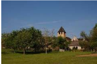
Village de Mialet