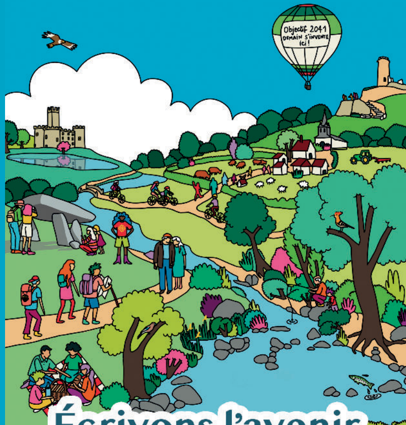
ILLUSTRATION ET MISE EN PAGE NISSA ABAÛJI

www.pnr-perigord-limousin.fr/revision-de-la-charte/